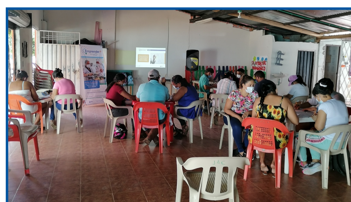
Entrenamiento Modelo de Negocios El Juncal, Aguachica - Cesar

Hemos contado con gran acogida por parte de la comunidad y hemos venido cumpliendo con las expectativas y con los temas discutidos en las sesiones de entrenamiento las cuales apuntan al fortalecimiento y al empoderamiento económico de las comunidades locales.