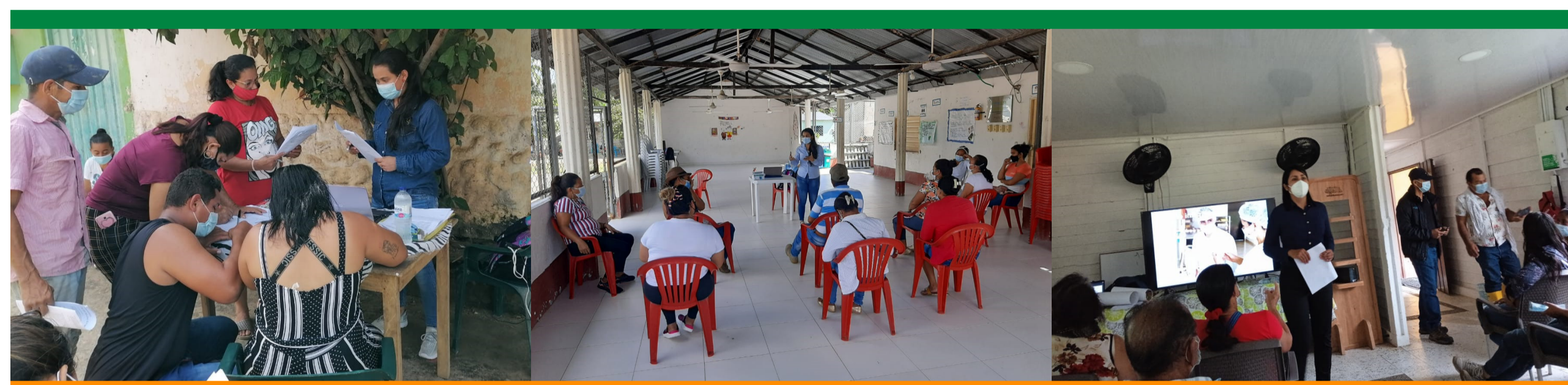
Socializaciones de Convocatoria en los territorios: Aguachica (El Juncal), San Alberto (La Llana) en Cesar y Piamonte (Miraflores) en Cauca

Debido a la alta acogida que recibió el programa en los municipios: San Martín, Aguachica, San Alberto, Río de Oro en Cesar y Rionegro en Santander, Mocoa, Villagarzón, Orito, Puerto Asís y Valle del Guamuez en el departamento de Putumayo y Piamonte en el departamento de Cauca; se amplió la fecha de inscripciones hasta el pasado 7 julio y se ajustó el cronograma de actividades establecido en los términos de referencia de la convocatoria del programa Emprender+ 2021 .