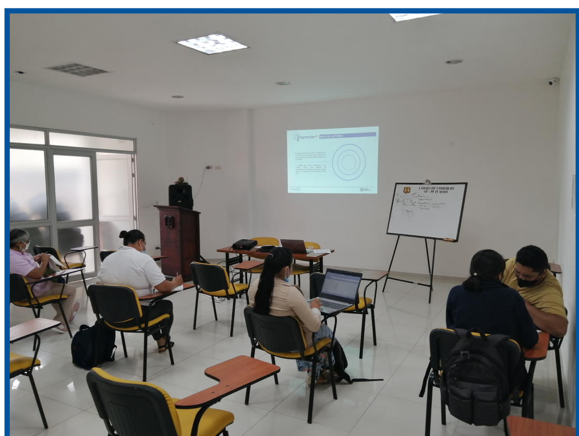
📍 Reto Emprender+ Mocoa Componente Empresarial

Gracias a la alianza estratégica entre Scotiabank , Gran Tierra Energy y Créame Incubadora de Empresas , inicia el componente de Reto Emprender+ el cuál busca generar cultura emprendedora en la población de los territorios de interés.