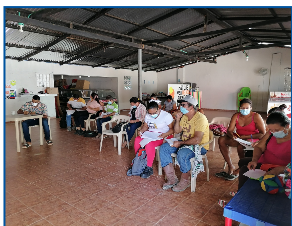
Entrenamiento en Pitch El Papayal - Rionegro

Entrenamiento Pitch , en este entrenamiento los asistentes aprendieron la metodología elevator pitch a través de la cual se realizan presentaciones efectivas precisas, concretas y directas de sus ideas de negocio o emprendimientos.