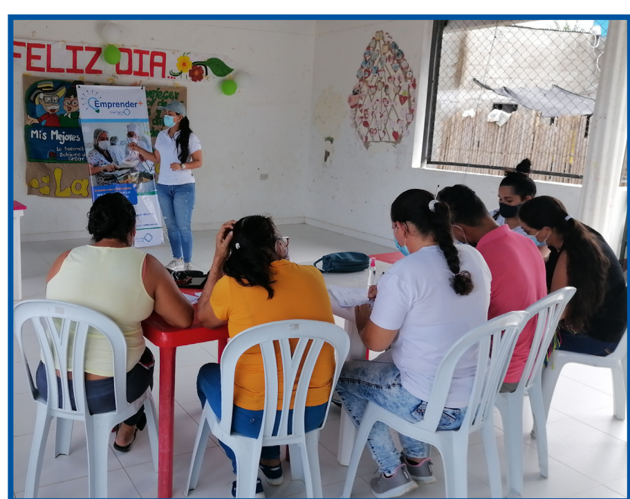
Entrenamiento Modelo de Negocios La Llana - San Alberto